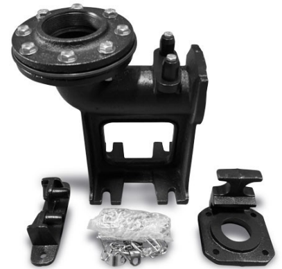
EL RIEL DE DESLIZAMIENTO RDSV3 SE VENDE POR SEPARADO