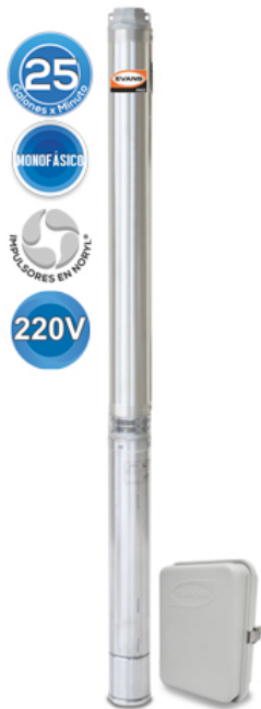
INCLUYE CAJA DE CONTROL

Bomba sumergible monofásica para pozo profundo 4", descarga de 2", 5 Hp. 220V